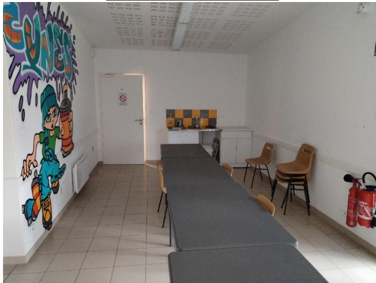
Entrée salle annexe de la Fontaine :