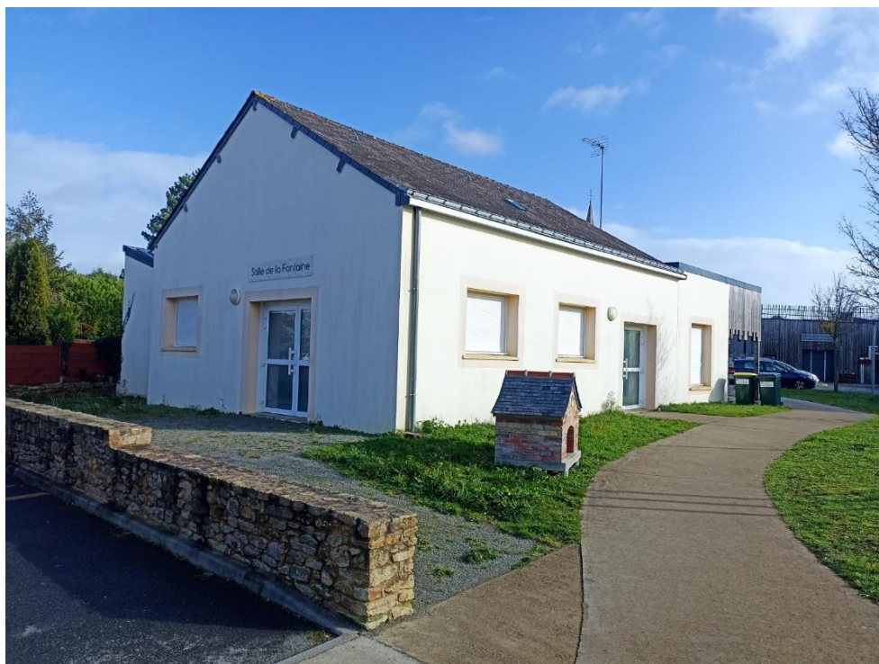
Salle de la Fontaine :